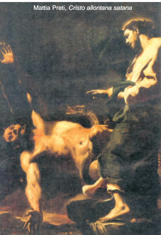
Mattia Preti, Cristo allontana satana

In simili teorizzazioni, l'uomo rischia di finire in una spirale diabolica che lo proietta lontano da Dio.