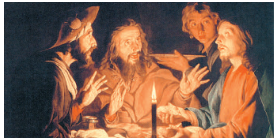
Gerrit Van Honthorst, Cena in Emmaus

E quest'acqua, l'acqua della formazione permanente e della relazione con tanti altri cercatori dell'unica fonte, ha continuato a scorrere e a travasarsi, quasi come un sistema di vasi comunicanti tra le esperienze di crescita spirituale legate al cammino dell'Equipe e quelle di consultazione, elaborazione, accompagnamento e catechesi impostate nelle commissioni pastorali parrocchiali, diocesane, regionali... della Chiesa cosiddetta ufficiale. In ogni occasione ciò che ci ha sempre molto colpito è stato il verificare che là dove si costruisce e si diffonde la pastorale ordinaria delle nostre Comunità, l'apporto di persone come noi provenienti da cammini di formazione nei Movimenti,