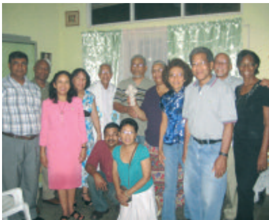
Prima équipe di Trinidad con alcune coppie aggiunte

concedere l'autorizzazione a lanciare un'equipe. La preoccupazione del precedente arcivescovo Pantin quanto alla moltiplicazione di piccoli gruppi sembrava premonitrice. È in effetti la stessa preoccupazione dell'arcivescovo attuale, Edward Gilbert. Nonostante questo, le Equipes sono ora ben integrate nel seno della commissione per il matrimonio e la famiglia e le coppie appartenenti alle Equipes sono ormai riconosciute per il loro equilibrio e la loro esperienza, ma sono in qualche maniera in concorrenza con numerosi altri gruppi sulla famiglia e per questo la loro diffusione è più difficile. In effetti alcune coppie non trovano interesse a fare parte di più gruppi.